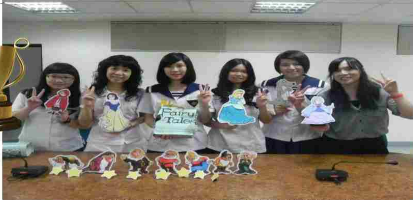
106年外語群專題製作比賽專題類全國第五名