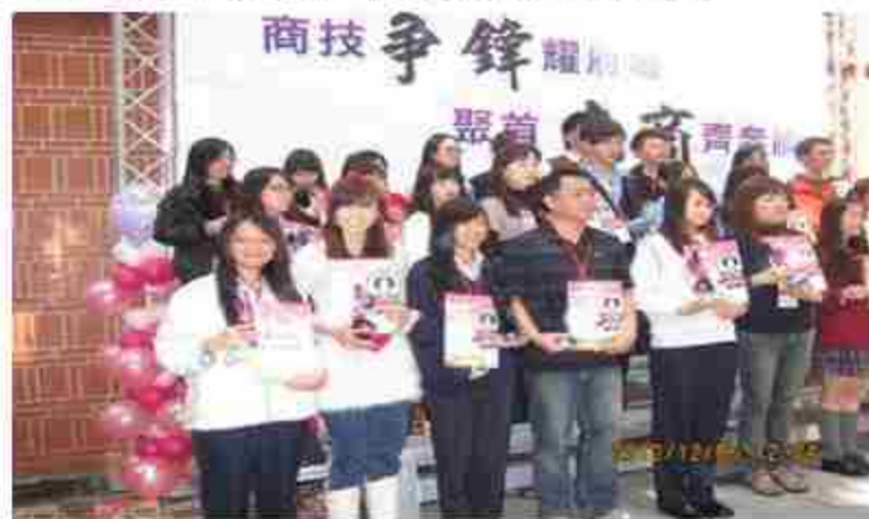
101學年度職場英文技藝競賽—金手獎第六名