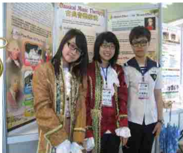
99年外語群專題製作比賽簡報類全國第四名