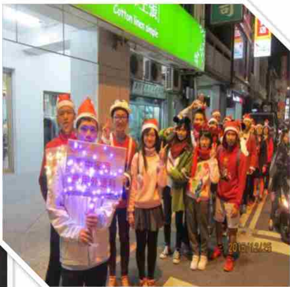
聖誕節彰化踩街遊行報佳音