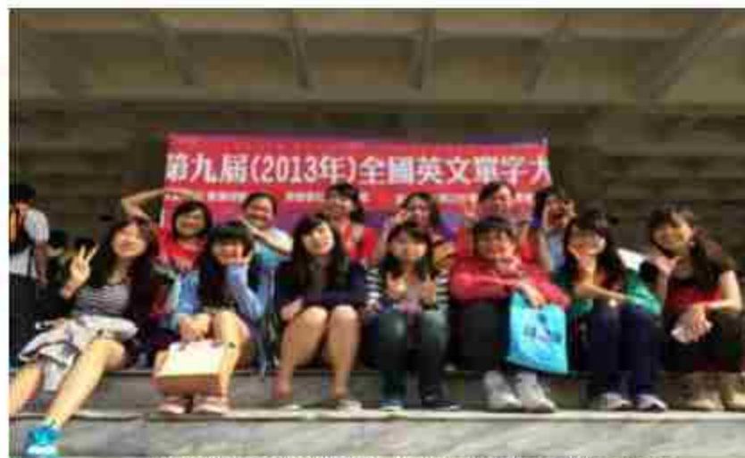
102學年度指導學生參加全國英文單字大賽 和朝陽科大單字大賽(朝陽科大比賽德高中職組第六名)