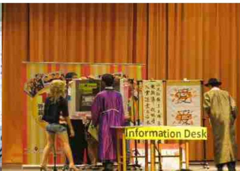
101學年度外交小尖兵比賽榮獲中區優勝