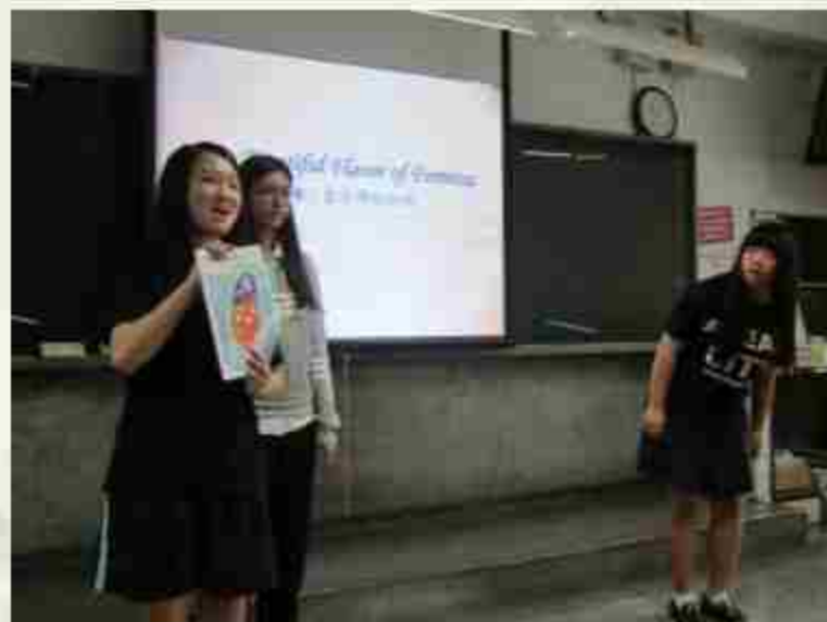
學生使用數位講桌與投影機 教學英文簡報