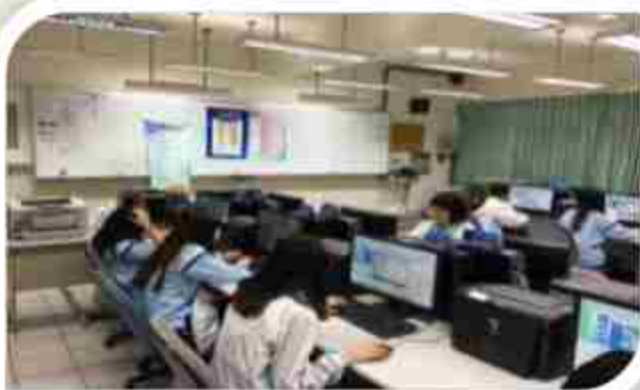
會計資訊乙丙級檢定