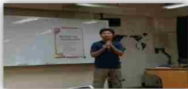
外貿協會經理:國際貿易交流