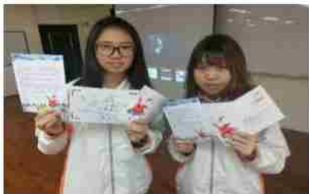
寫信給各國聖誕老公公