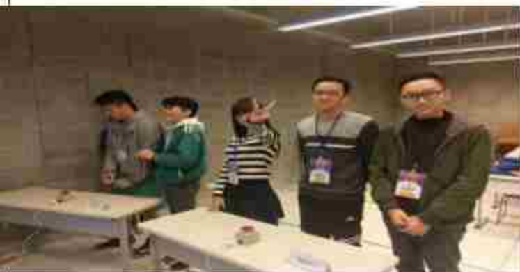
英語機智問答比賽