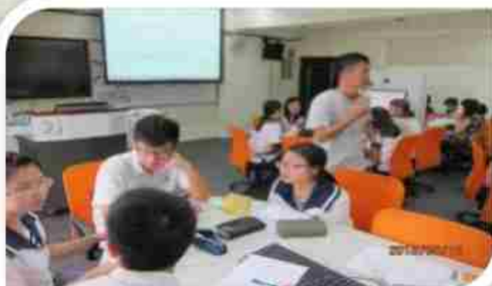
創意教室:小組討論 專題製作