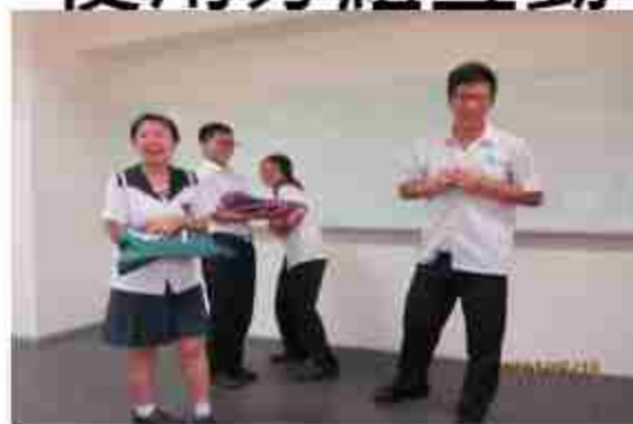
分組完成學習 單上台表演