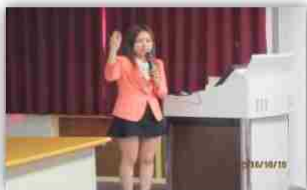
TVBS新聞台外語編譯陳姵如