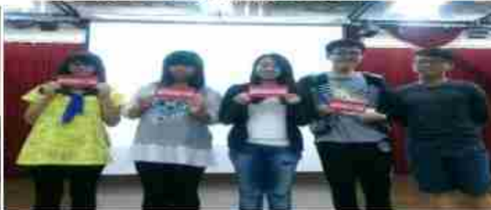
南台科大英文單字大賽