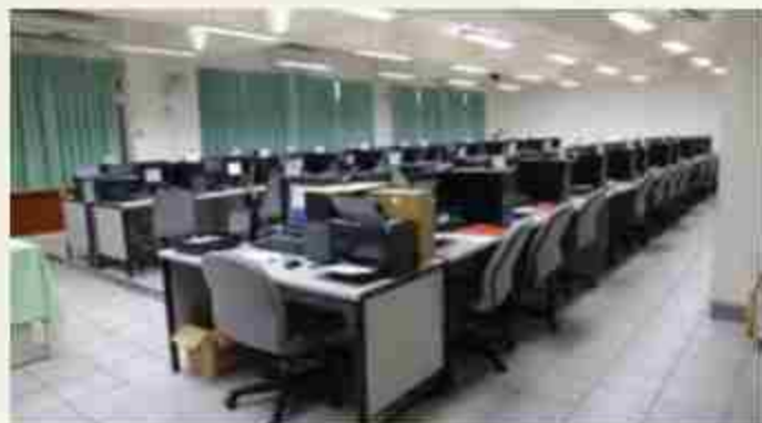
電腦軟體應用乙丙級檢定教室