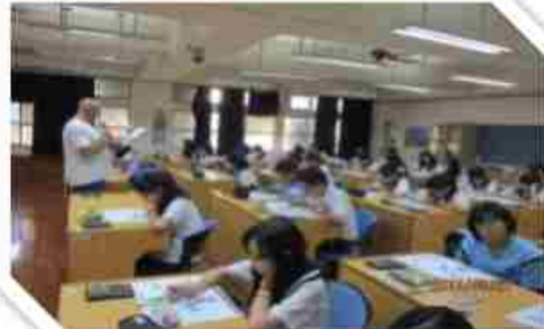
外師卜全校英檢班