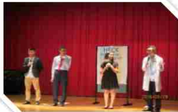
全校英文說故事比賽