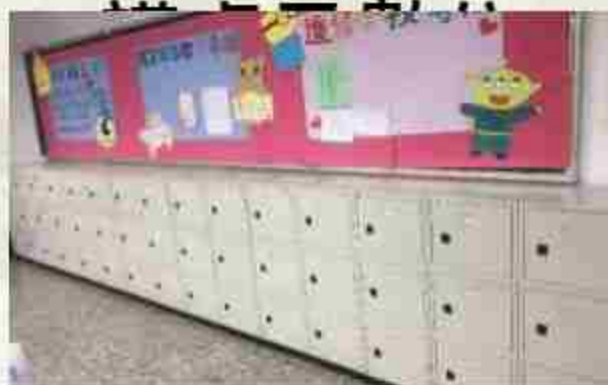
教室全面設置 學生置物櫃