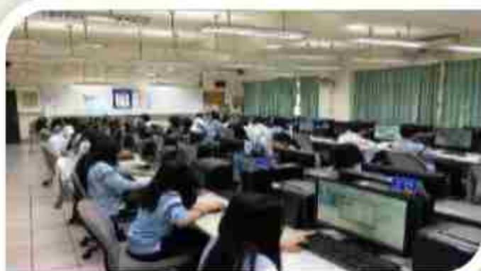
電腦教室六:英又單子分級檢定軟體