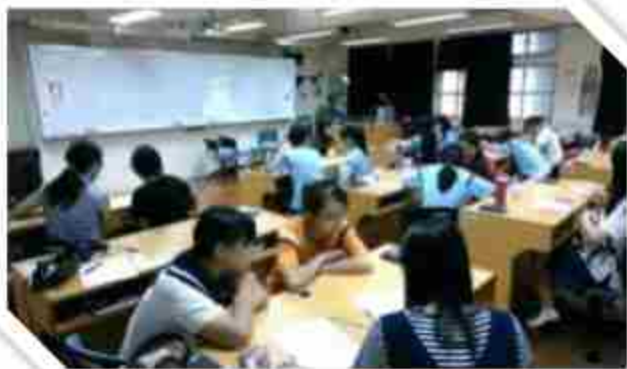
外師貿科協同教學