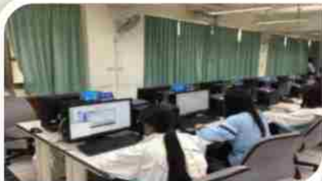
電腦教室:計概課.中英打練習