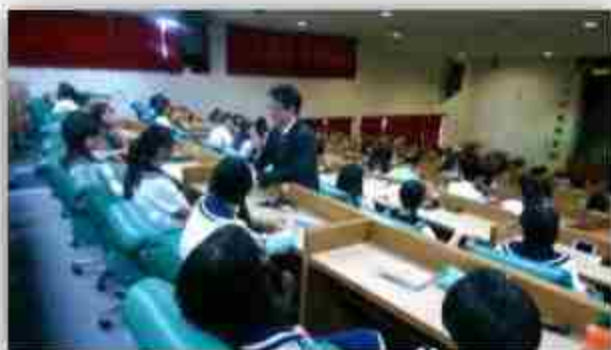
永豐銀行經理介紹金融業