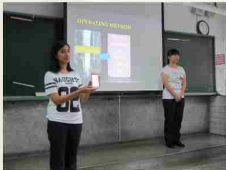
教室全面數位化 大幅提昇英文口說能力