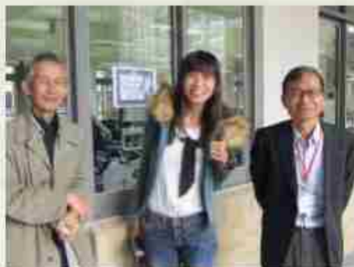
碰到彰師大教授和師培生