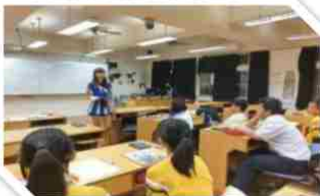
高一英文扶助教學