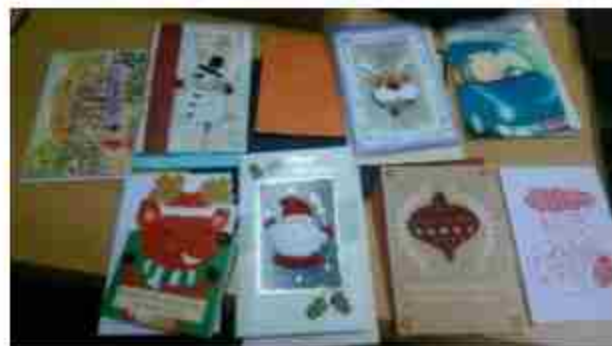
菲律賓中學生卡片交換