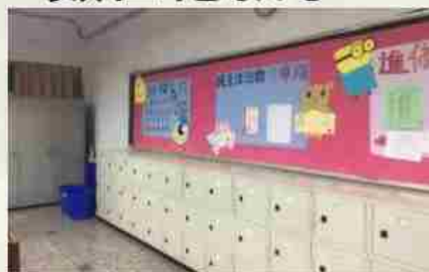
置物櫃提升學 生學習便利性