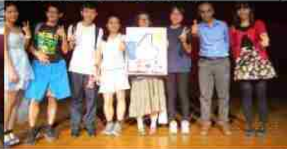
全國英語說故事比賽