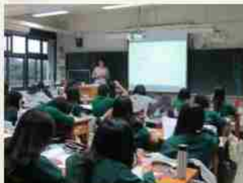
葉老師教學創意源源不斷