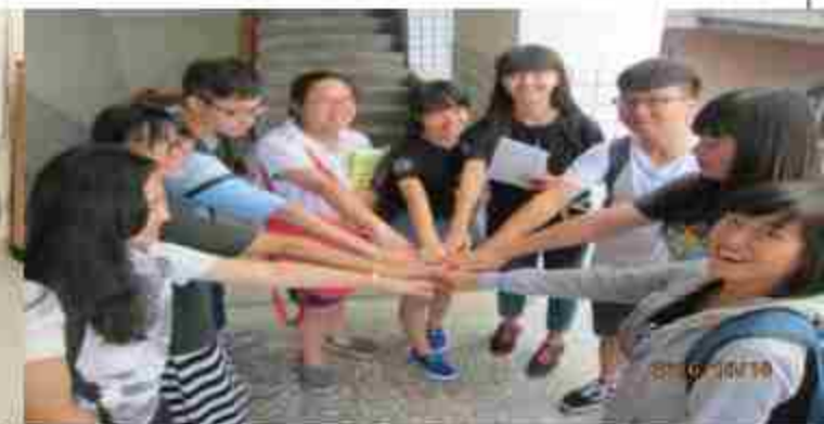
全國英文單字大賽