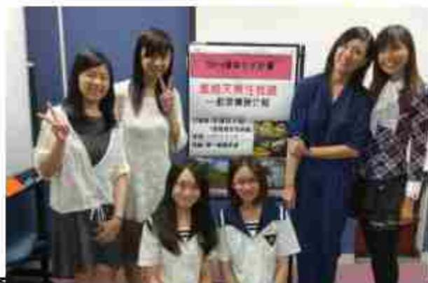
優秀校友返校航空業職涯介紹