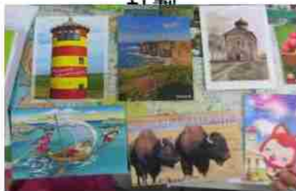
世界明信片交換活動