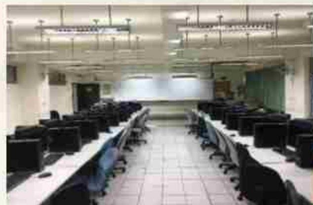
會計資訊乙丙級檢定教室